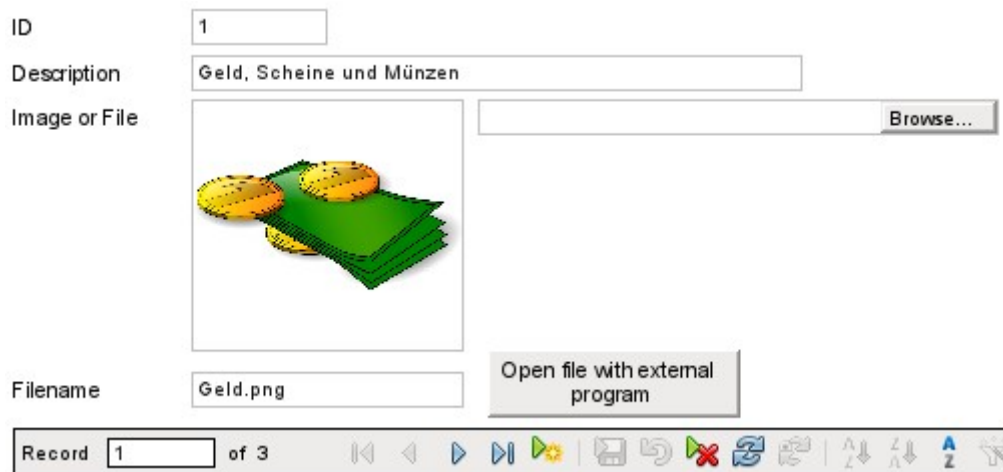
Figura 2: Formulario fileimport_name de la base de datos de ejemplo Example_Documents_Import_Export.odt

Si los archivos de imagen están presentes en la base de datos, se pueden ver en el control gráfico del formulario. Todos los demás tipos de archivo son invisibles.